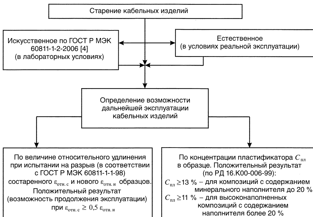
Рис. 1. Схема исследования изоляционных материалов на старение

Однако знание этих критических значений параметров характеризует, прежде всего, изменение в худшую сторону лишь механических свойств исследуемых материалов (снижение эластичности, появление хрупкости и пр.). Как показали исследования, проведенные в ФГУ ВНИИПО, значения нормируемых в соответствии с ГОСТ Р 53315-2009 [5] показателей пожарной опасности кабелей при этом или улучшаются, или остаются без изменений.